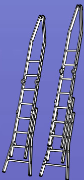
Tweedelige puntladder (28 cm optrede)